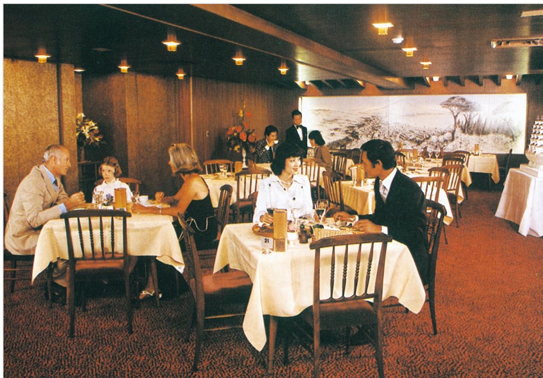
《1980年頃のコンチネンタルルーム》

ホテルオークラ東京では、2010年2月1日(月)～28日(日)の期間、欧風料理オーキッドルーム(本館5階)において「オークラ洋食の原点～コンチネンタルルーム～美食家が集う思い出の食卓」を開催いたします。