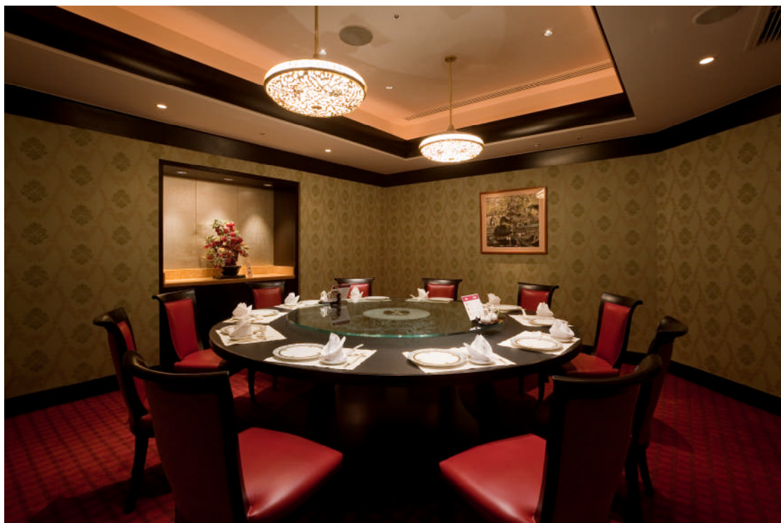
< 新個室「桃泉」 >

また、このたびのリニューアルを記念して、お手頃な価格でお召し上がりいただける特別コースを 1 月 29 日（木）～3 月 31 日（火）の期間限定でご用意いたしました。