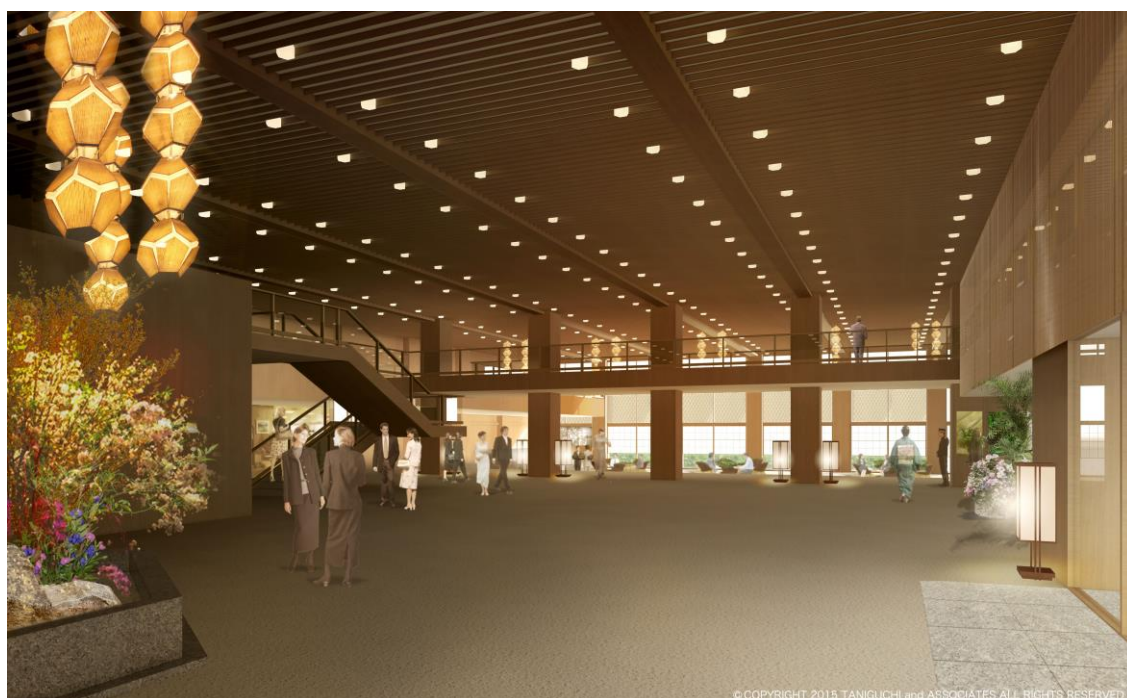
新本館ロビー イメージパース

2019年の新本館の開業時には、これまで皆様に愛されてまいりました旧本館のデザインが継承されたロビーにて皆様をお迎えいたします。